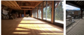
200m 2 au Grenier